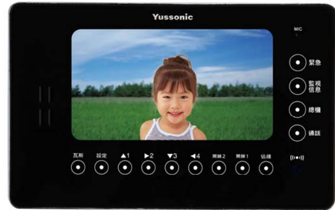
本機榮獲中華民國專利設計第 D154423 號