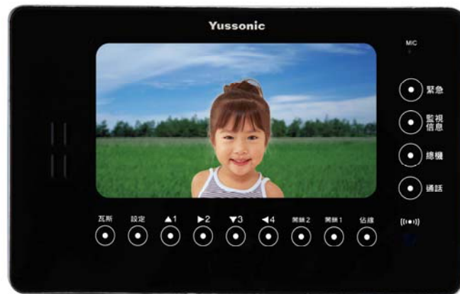
本機榮獲中華民國專利設計第 D154423 號