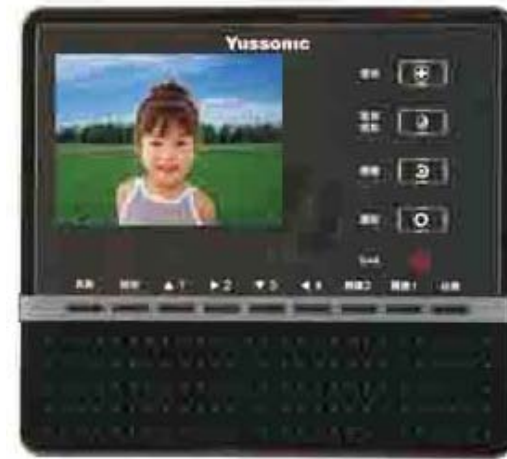
本機新式樣專利第 D147569 號