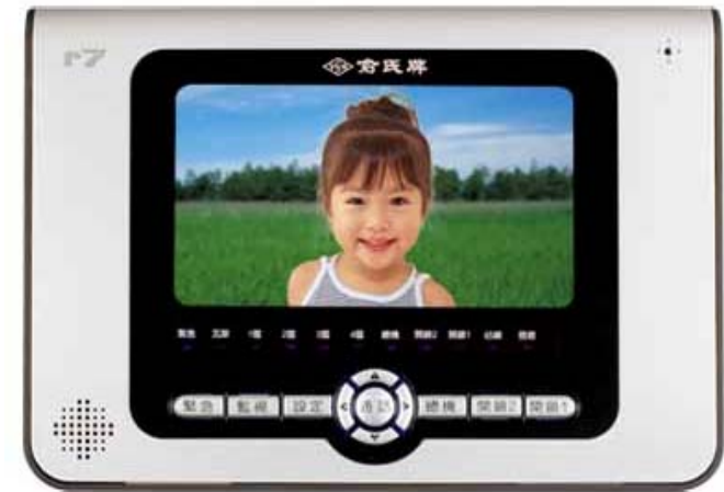
本機新式樣專利第 D120261 號