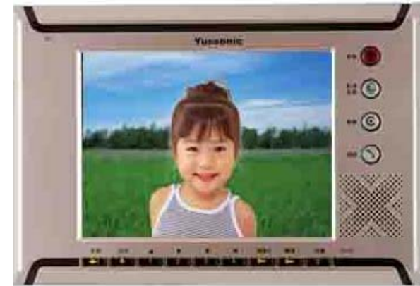
本機新式樣專利第 D147752 號