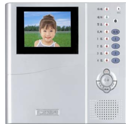
本機新式樣專利第 D120803 號

謝謝您使用本公司出品的俞氏牌YUS180數位電視對講系統。本系統是由影像室內機、攝影門口機、影像管理總機及其他設備所組成。有關影像室內機、攝影門口機及影像管理總機的機能，將成為您在日常使用對講機之呼叫通話、影像監看、門禁出入、防盜報警的最佳管理機能。