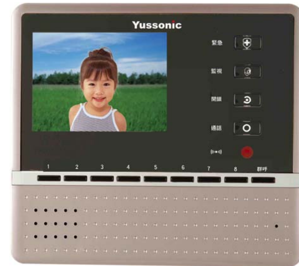
本機新式樣專利第 D147569 號