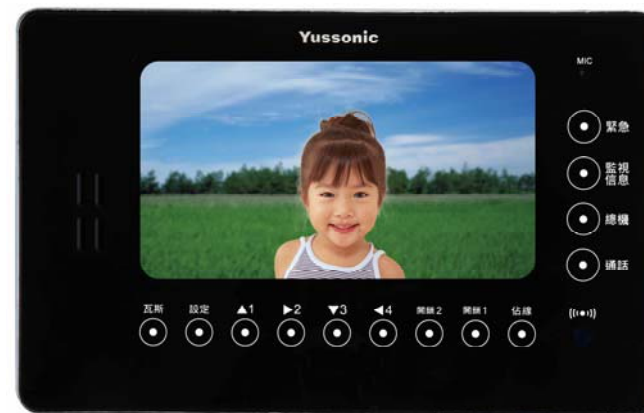
本機榮獲中華民國專利設計第 D154423 號