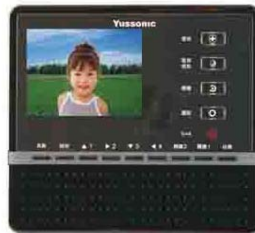
本機新式樣專利第 D147569 號