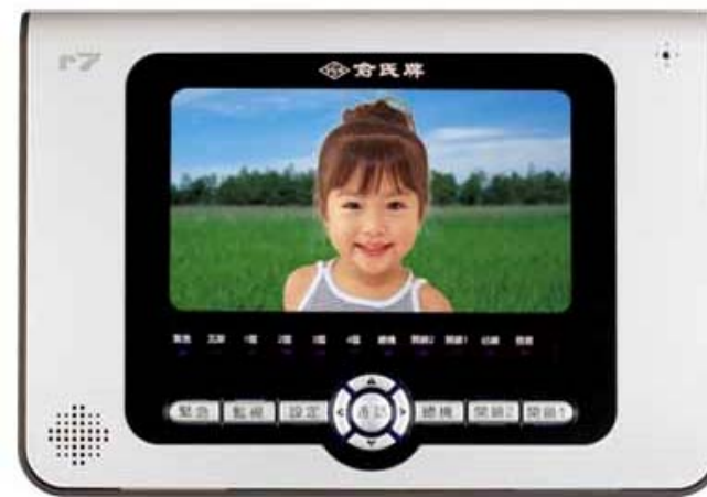
本機新式樣專利第 D120261 號